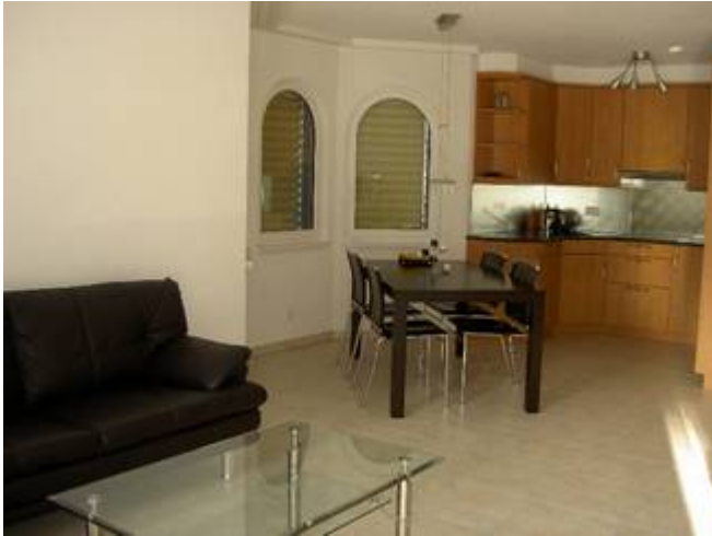
Wohnen / Küche