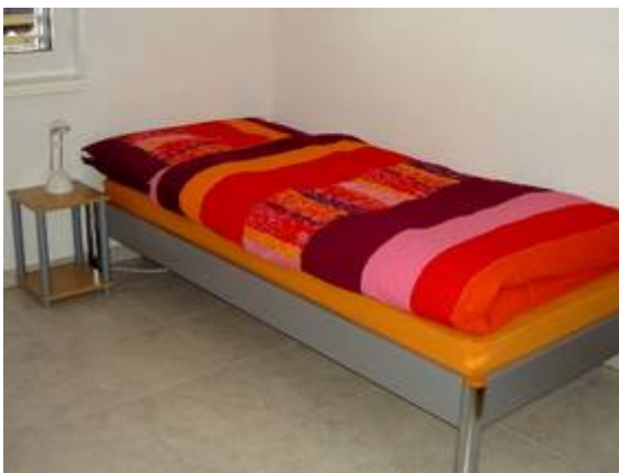
Kinder Ansicht 1