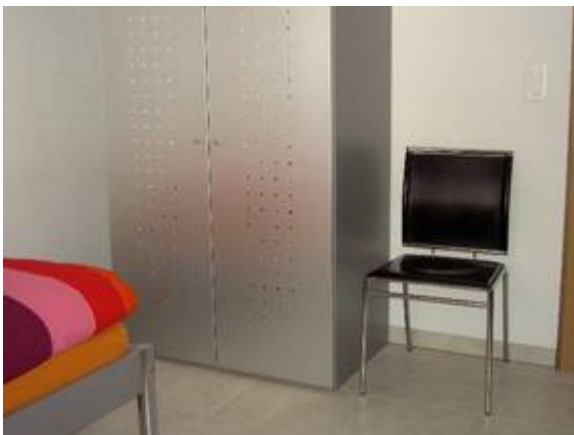
Kinder Ansicht 2

Lumino Immobiliare GmbH, Alte Strasse 33, 3713 Reichenbach i.K Telefon 033 676 04 34, Mobile 079 306 09 23