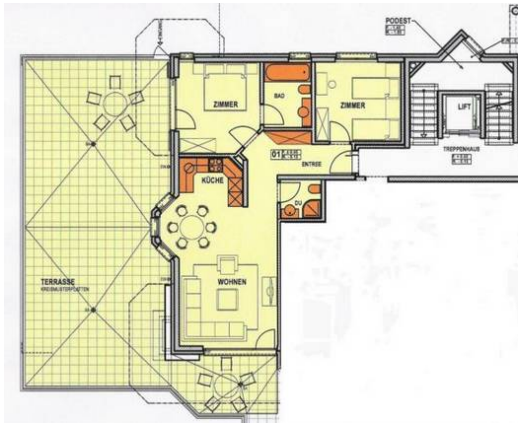
Plan Wohnung / Terrasse