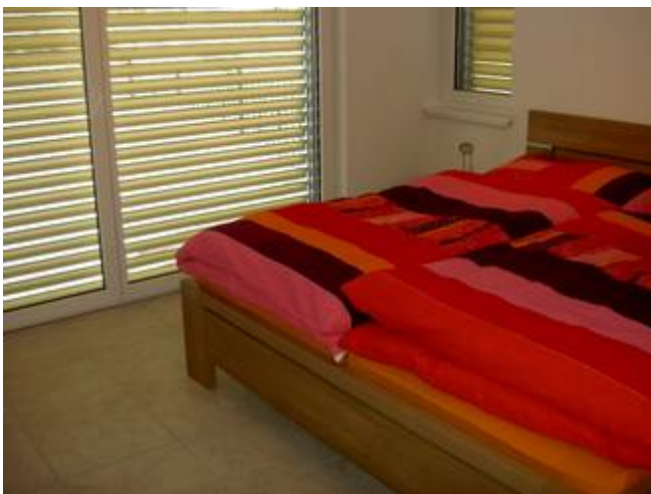
Schlafen Ansicht 1

Lumino Immobiliare GmbH, Alte Strasse 33, 3713 Reichenbach i.K Telefon 033 676 04 34, Mobile 079 306 09 23