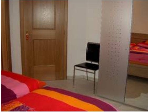
Schlafen Ansicht 2